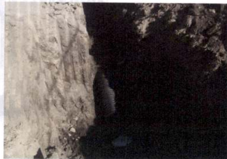
TENIENTE NIEVA 2705 COL. OJO DE AGUA C.P.74042 SAN MARTIN TEXMELUCAN, PUE.