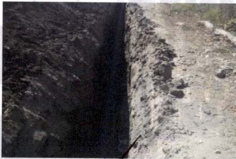
VERONICA PORTILLO GONZALEZ R.F.C: POGV790424LY0

3050 05 SUMINISTRO E INSTALACIÓN DE TUBO SANITARIO CORRUGADO DE POLIETILENO DE ALTA DENSIDAD TIPO N-12, INTERIOR LISO, DE 12" DE DIAMETRO C/CAMPANA & EMPAQUE NORMA NMX-E-241. 250.00 ML.