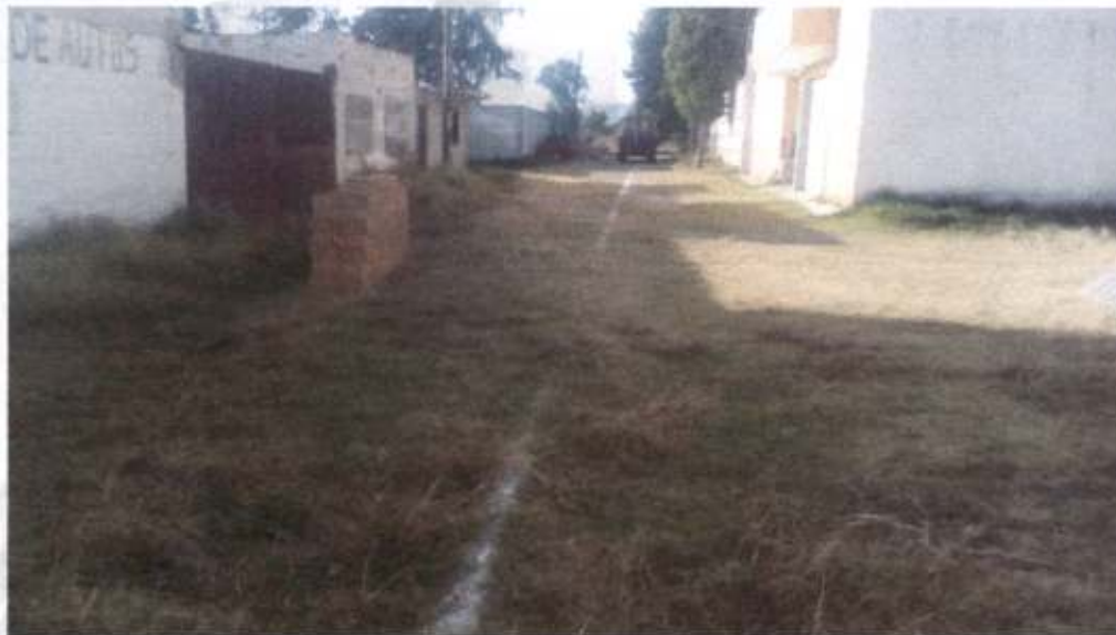
EXCAVACION PARA DESPLANTE DE ESTRUCTURAS EN MATERIAL COMUN SECO.